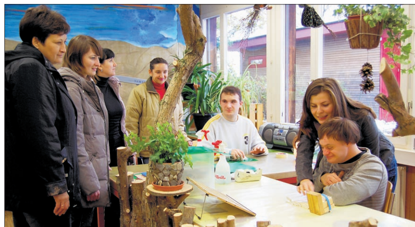
Die Einblicke im «Sunnebüel» geben den Ukrainerinnen Ideen für ihre Aufbauarbeit im Pionierprojekt «Parasolka».

Dank langjährigen Kontakten und dem grosszügigen Entgegenkommen des Heilpädagogischen Zentrums können zurzeit vier Praktikantinnen aus der Ukraine im «Sunnebüel» wertvolle Erfahrungen für das Pionierprojekt «Parasolka» sammeln.